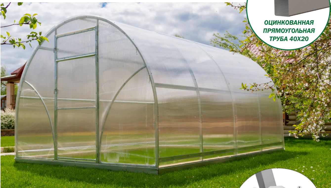
ОЦИНКОВАННАЯ ПРЯМОУГОЛЬНАЯ ТРУБА 40x20